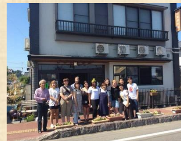
▲海外の学生たちと国際交流

2012年に、名古屋にあるNPO「チェルノブイリ救援・中部」が南相馬に開いた「放射能測定センター・南相馬」で、ボランティア活動に参加しました。今も出来る限り参加しております。知らなかった原発、放射能のことを教えてくれた所です。汚染マップの測定ボランティア参加、チェルノブイリスタディーツアーの参加。日本の原発事故の現状を知り、学び、考えることを、伝えることを続けたいと思っております。この福島事故が、最後になるように。