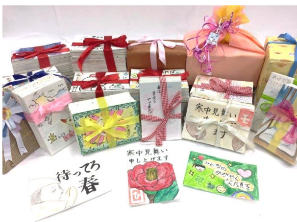
▲贈呈された3,771枚の絵手紙

2018年12月 3,771枚／あま市の全小中学校、あま市教育相談センタービリーブ、豊川市の中学校美術部